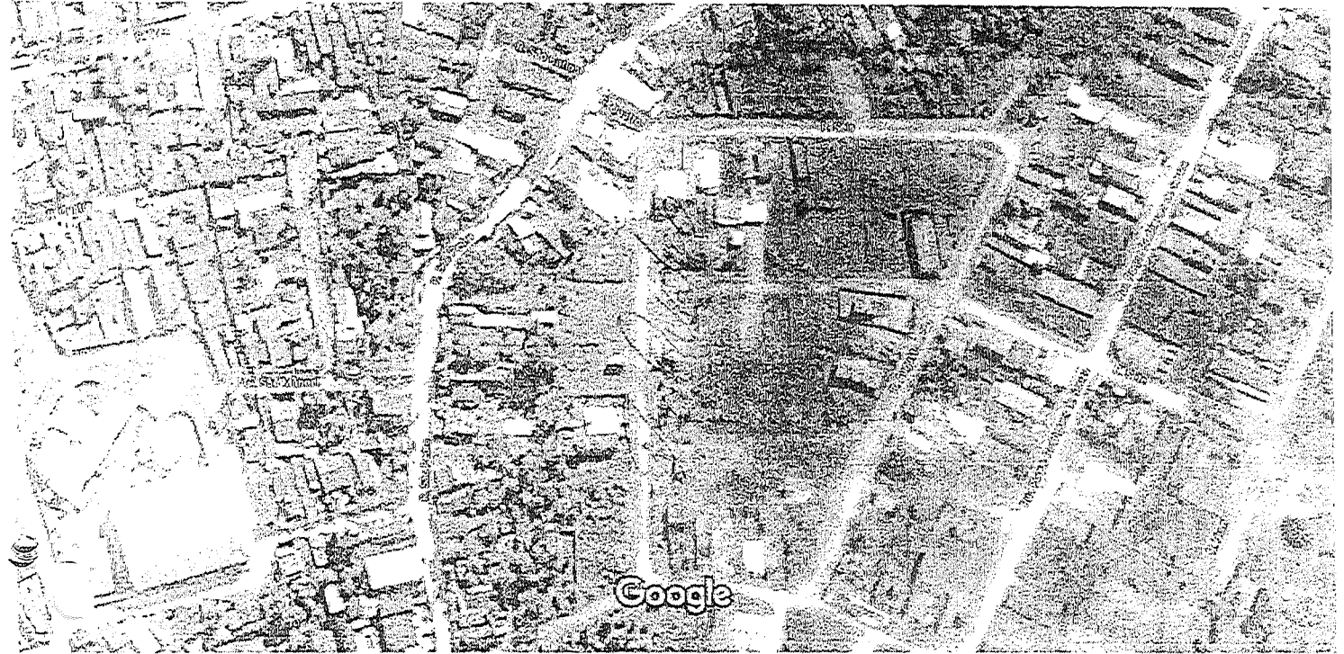
Imagens ©2017 DigitalGlobe,DigitalGlobe,CNES / Airbus,Dados do mapa ©2017 Google 100 pés